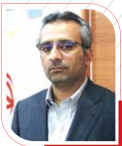
معاون هماهنگی امور عمرانی استانداری هرزگان

وی در خصوص توسعه اسکله منطقه ویژه به‌عنوان یکی از راهکارهای رونق صادرات، عنوان کرد: اسکله منطقه ویژه خلیج فارس به‌عنوان یکی از هاب‌های توسعه‌ای استان هرزگان در نظر گرفته شده است. این اسکله در حال حاضر نیاز