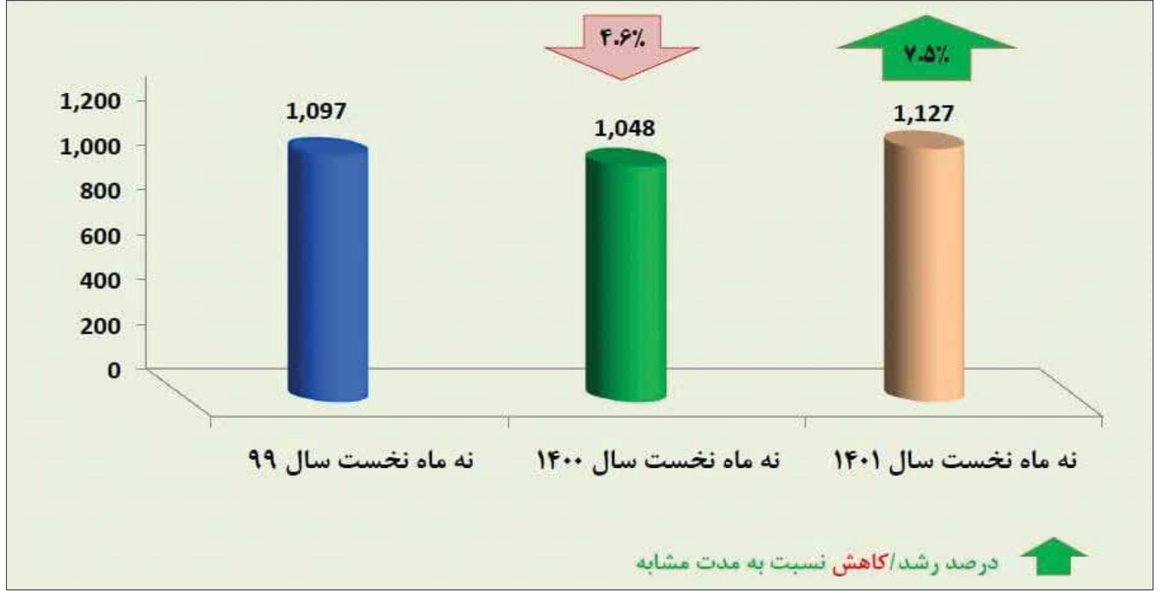
نمودار ۴ - مقایسه میزان تولید تختال در فولاد هرمزگان (هزار تن)